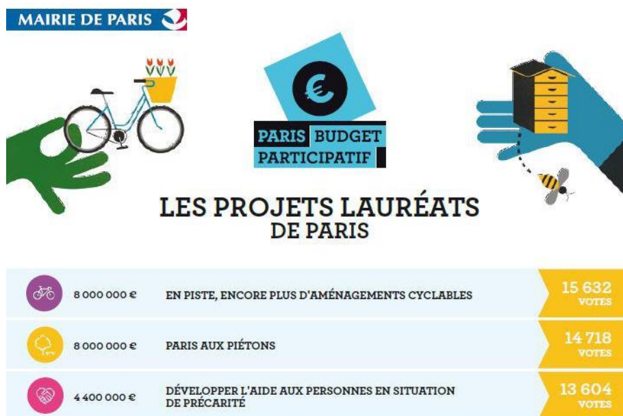
Résultats du budget participatif 2015 à Paris