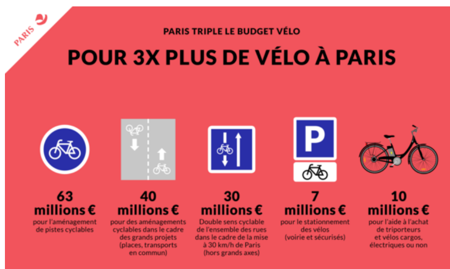
La ventilation prévisionnelle des 150M€ du Plan Vélo

Le mardi 14 avril 2015, le Conseil de Paris a dévoilé son Plan Vélo 2015–2020. Ce plan, adopté à l'unanimité, prévoit un investissement de plus de 150 M€ pour faire de Paris « La Capitale du vélo 2020 » et tripler le nombre de déplacements à vélo, avec un objectif de part modale de 15 %.