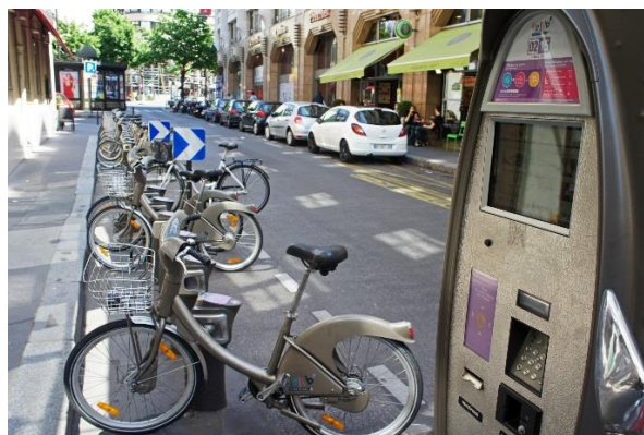
Station Vélib'

La démocratie participative est au cœur du projet municipal : pourquoi ne pas faire confiance aux usagers pour préparer Vélib' 2 ?