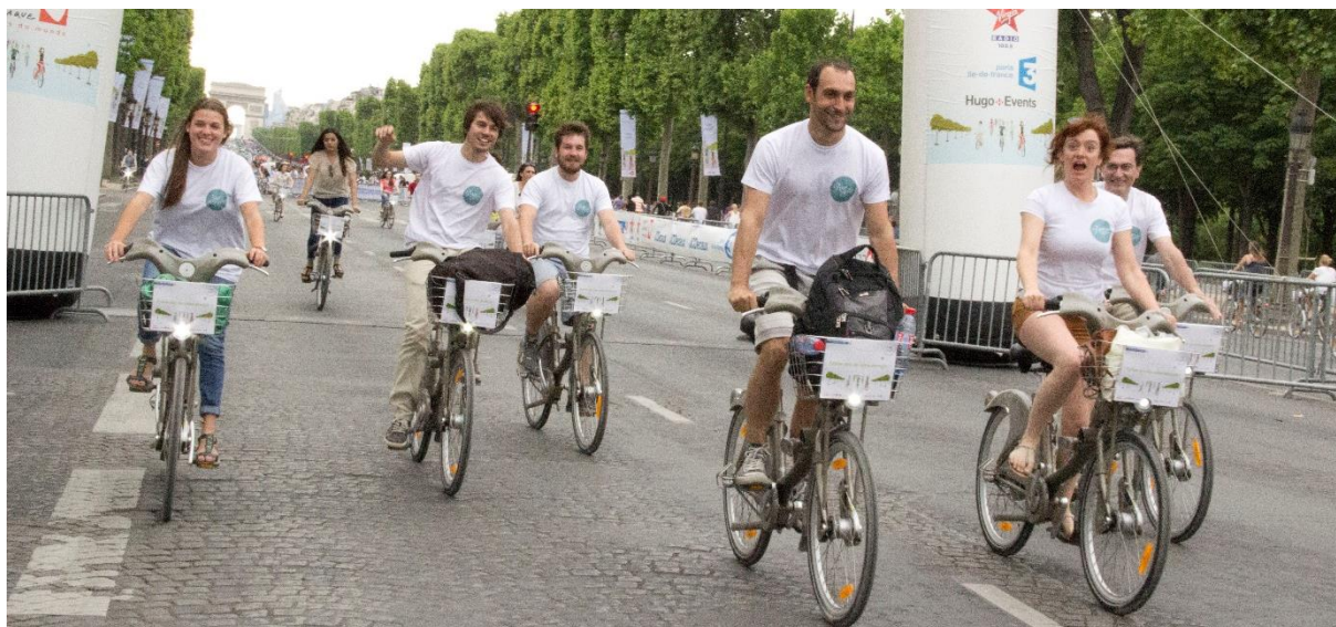
Les 24h Vélib', sur les Champs-Élysées en 2015

Paris en Selle maintient le cap et sa détermination pour travailler, avec la mairie de Paris, au succès du Plan Vélo. Nous voulons voir aboutir rapidement des projets ambitieux qui permettent de démocratiser l'usage du vélo , en rassurant tous ceux qui aujourd'hui encore renoncent à ce mode de déplacement de peur d'affronter « l'enfer du bitume parisien ».